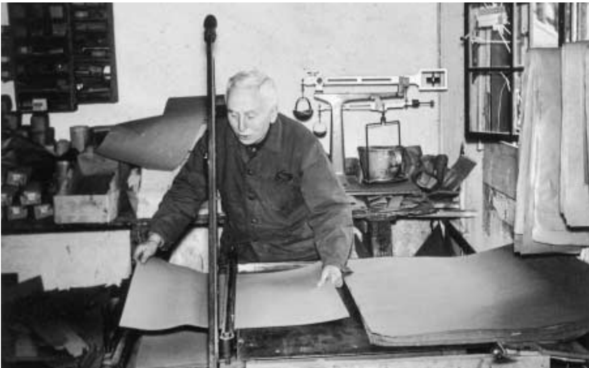
Schneiden von Verpackungsmaterial bei Sternberg, 1960, Anton Rickert