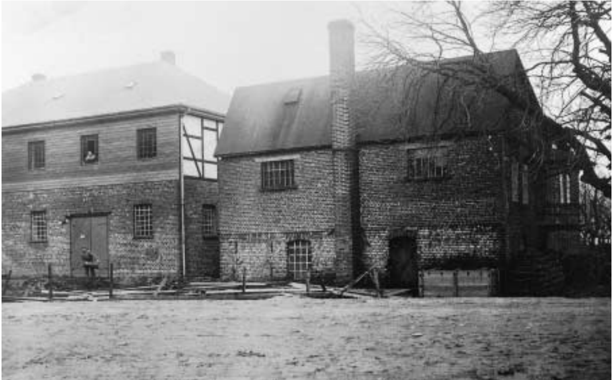
Fabrik Sternberg im Jahr 1936