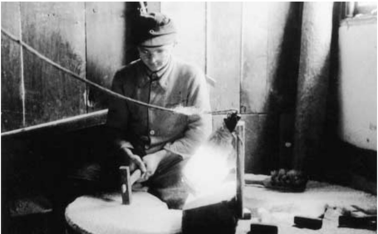
Behauen des Mühlsteins mit Kraushammer, Mühle Schürmann, 1949