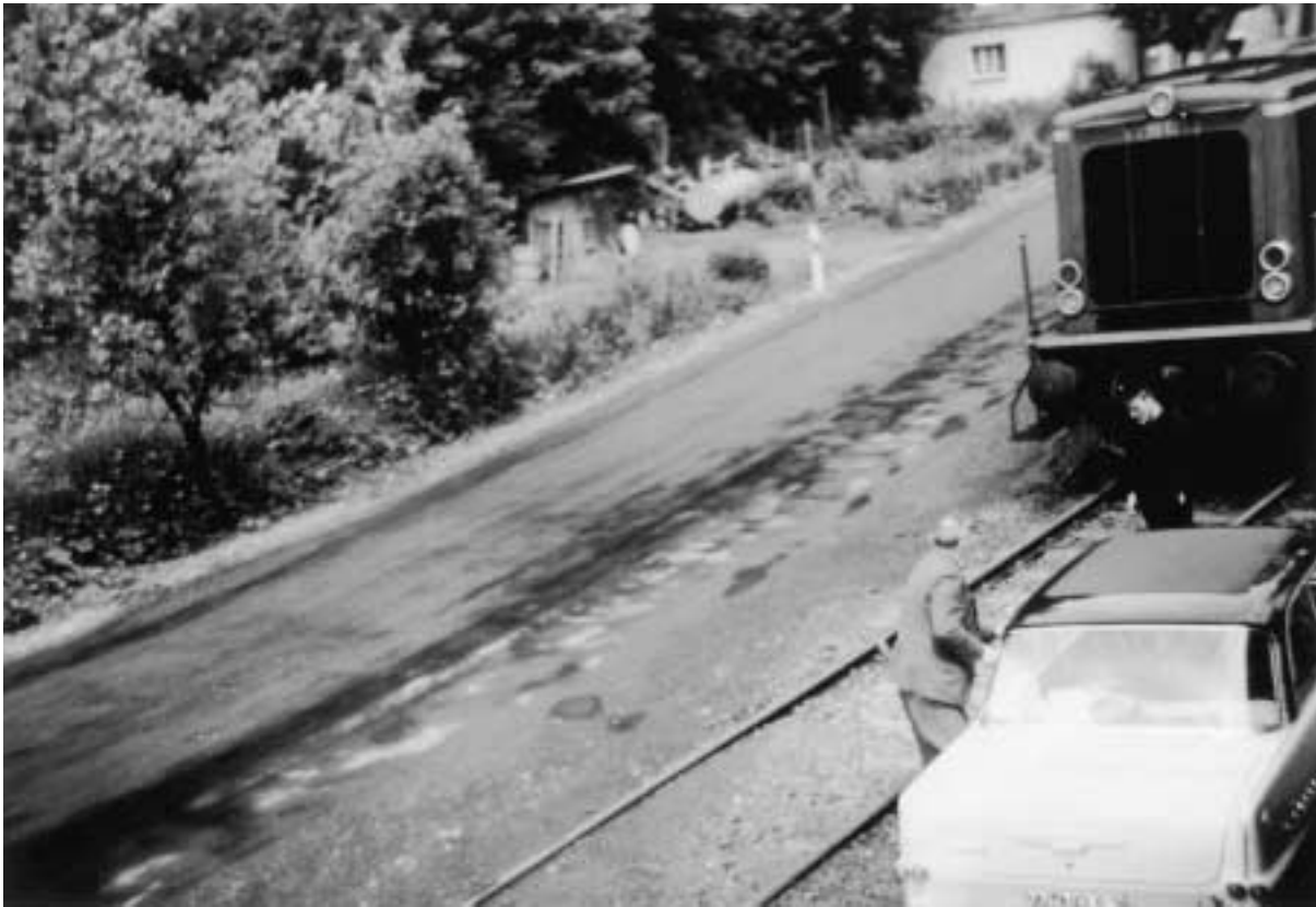
parkender PKW behindert Zug bei Gasthof Heimes Willmes, 1963