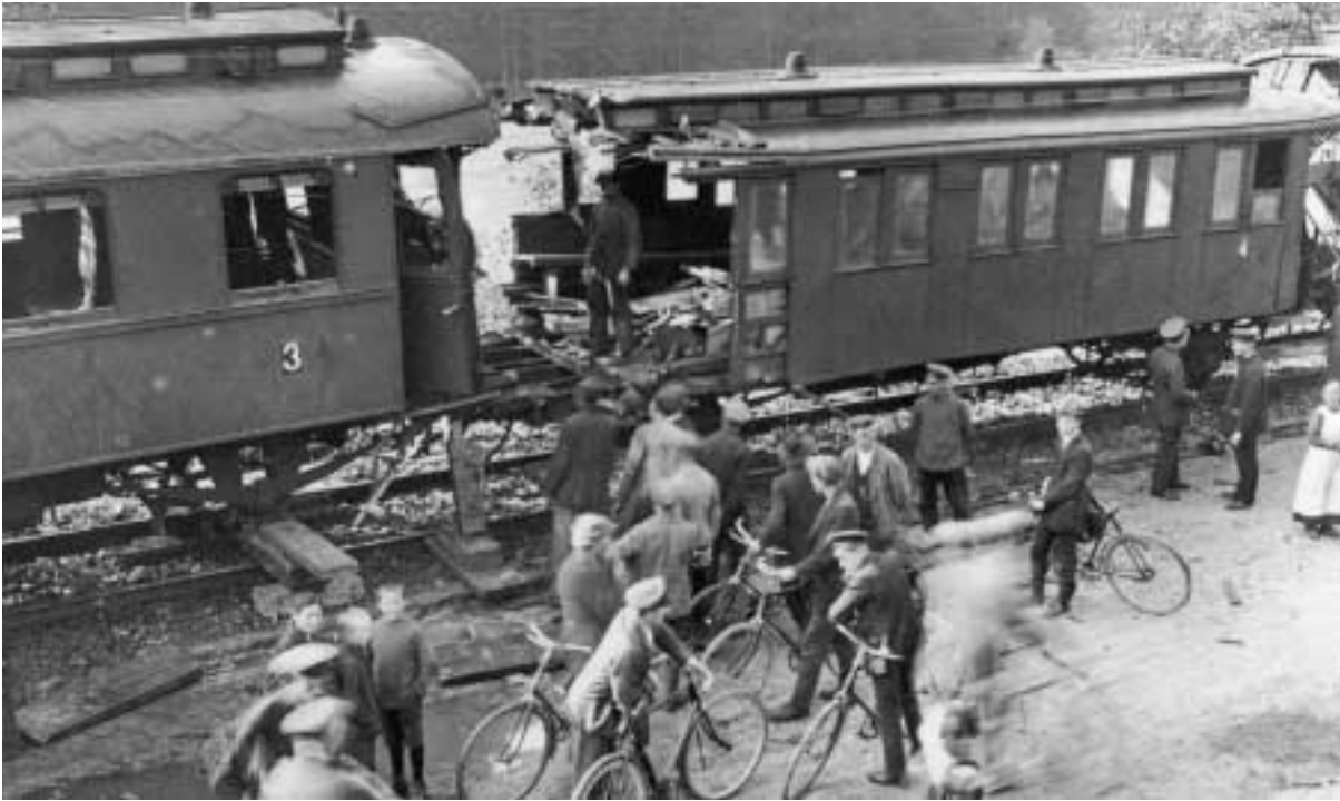
Zugungleisung oberhalb Hude, 1921