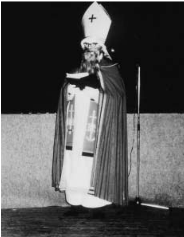
Der Nikolaus kommt zur alljährlichen Feier der Kinder in die Schützenhalle, 1973