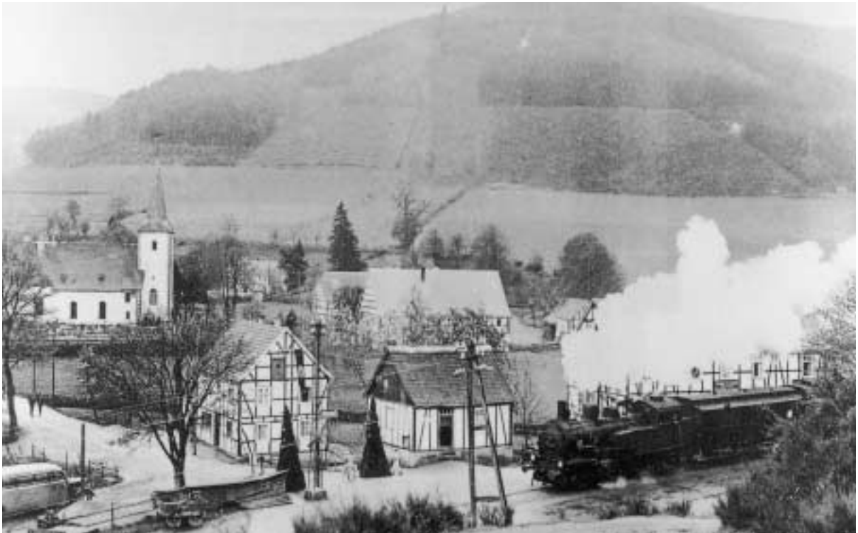
Zug in Lenne, 1936