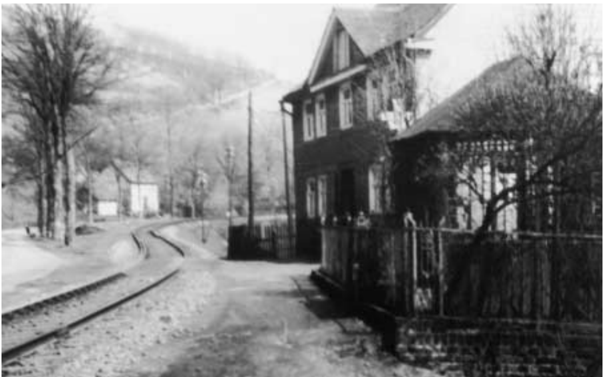
Eisenbahngleise bei Heimes Willmes, 1950