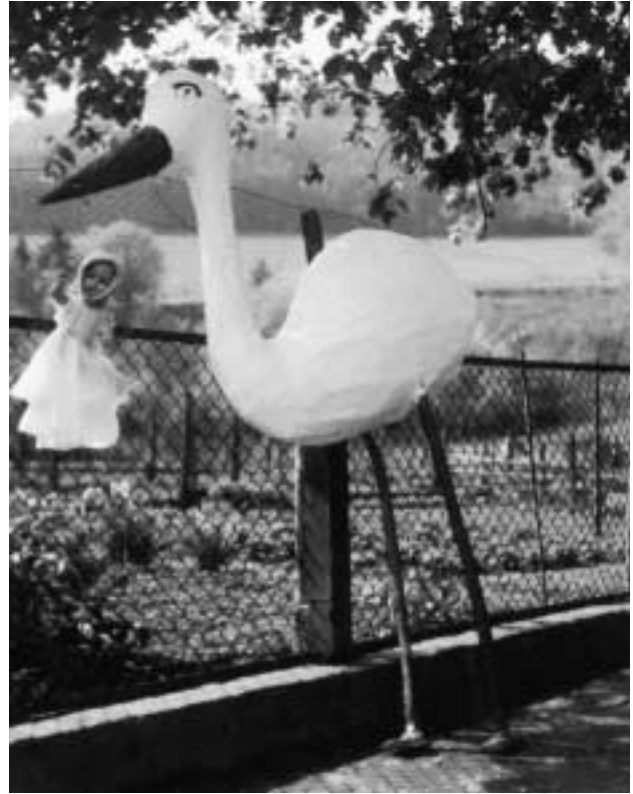
Der Lenner Hochzeitsstorch, 21.5.1963