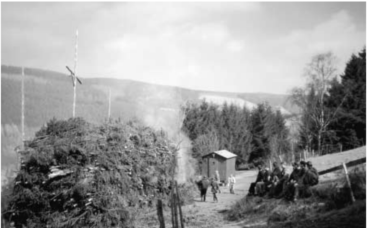
Osterfeuer, April 1996