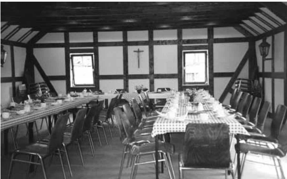
Veranstaltungsraum im Obergeschoß des Pfarrheims, 1993