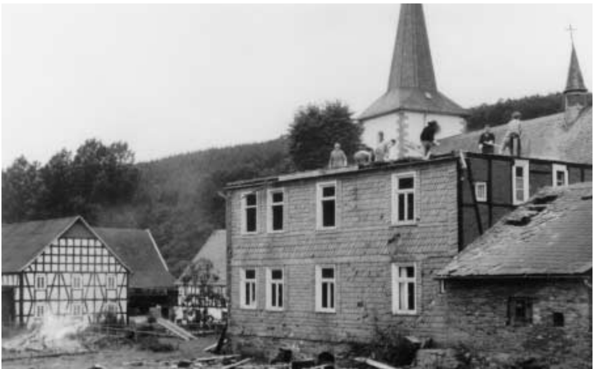
Abriss der Küsterei durch die Feuerwehr, 1980