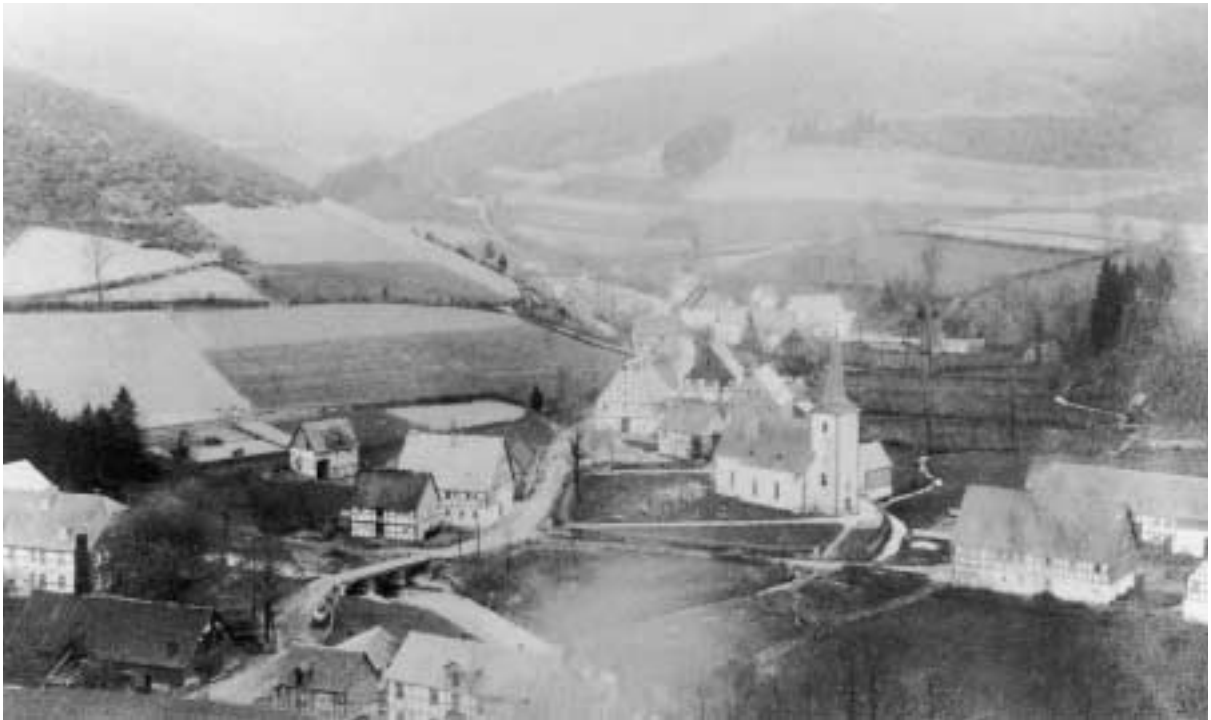
Lenne im Jahr 1890