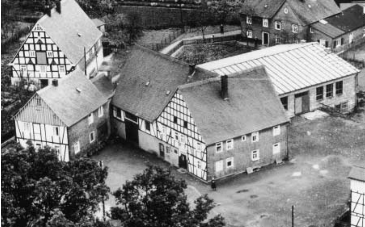
Anbau der Schützenhalle, 1955-56