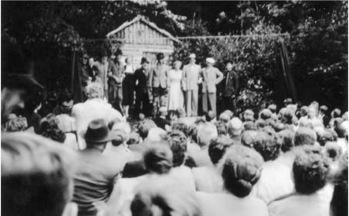
Harbecker Waldbühne am Krähenberg, 1953