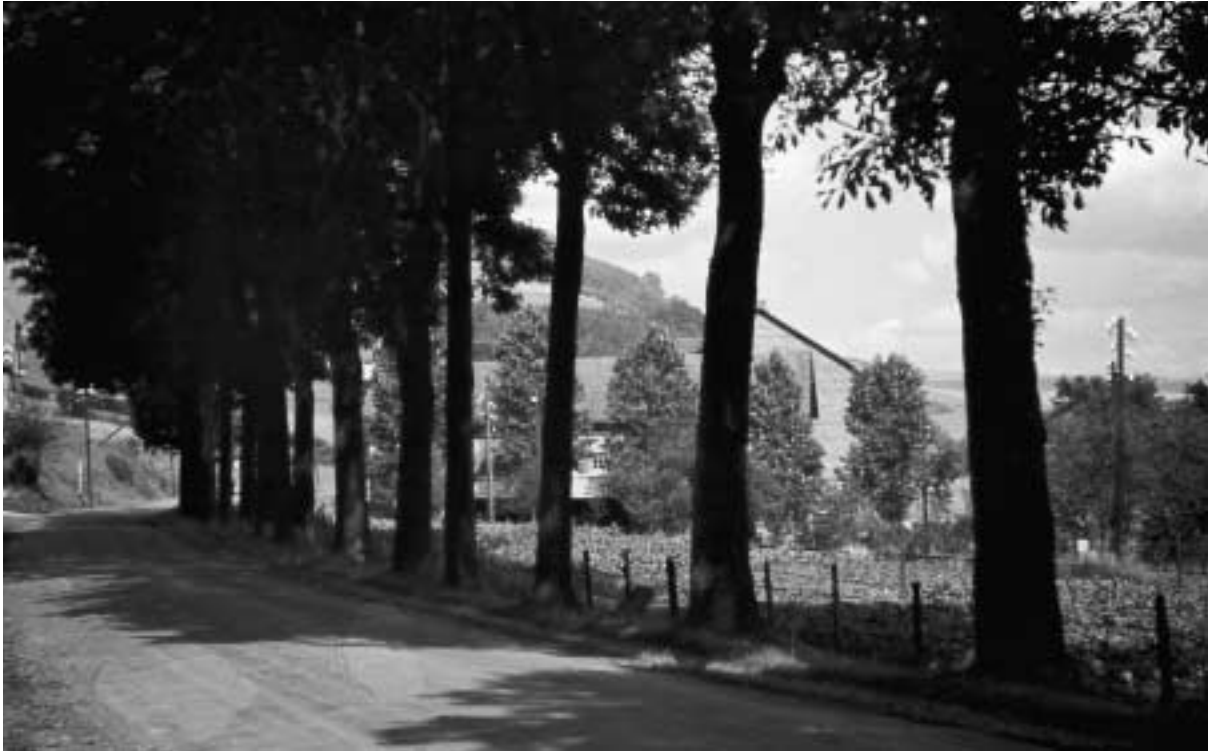
Bundesstraße beim Harbecker Weg, 1942