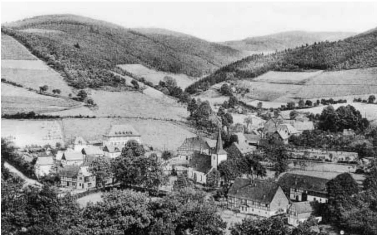
Dorfansicht von Lenne im Jahr 1930