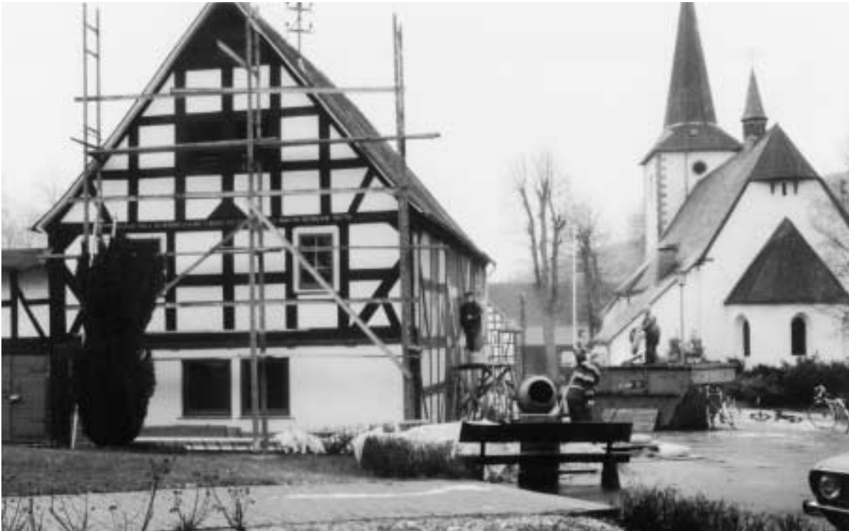
Freilegung des alten Fachwerks am Pfarrheim 1983-84