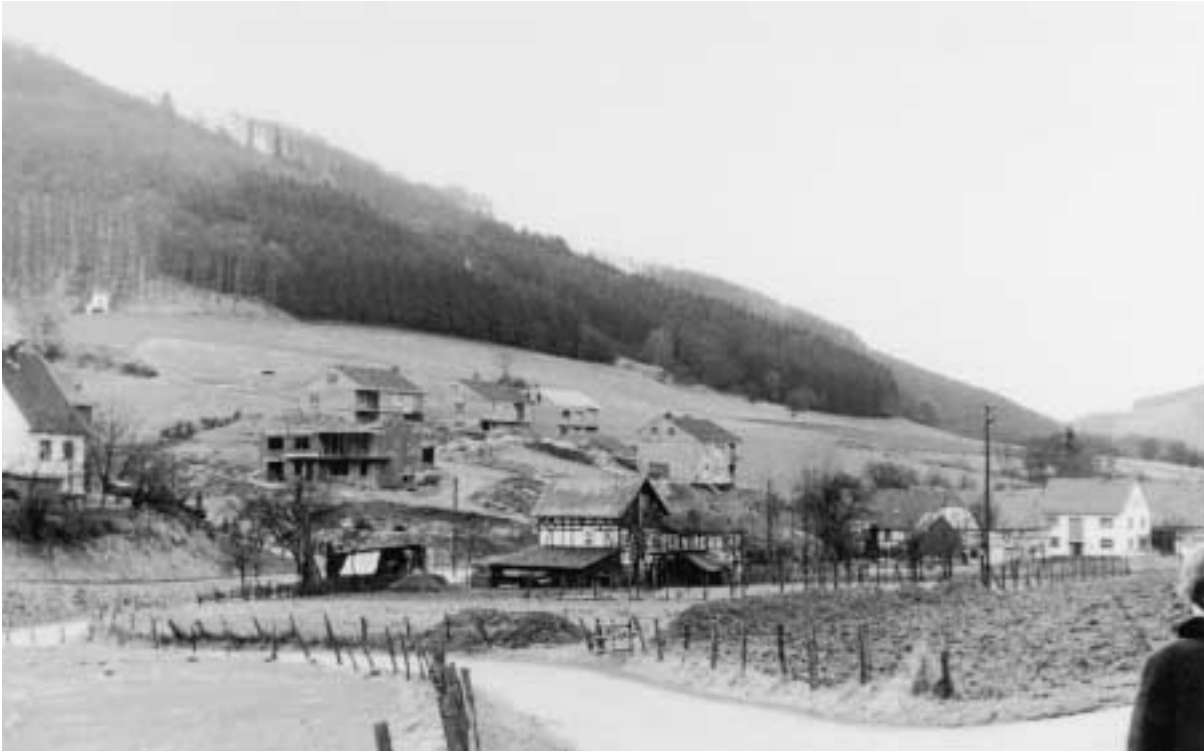
Siedlung am Hackebeil, 1967