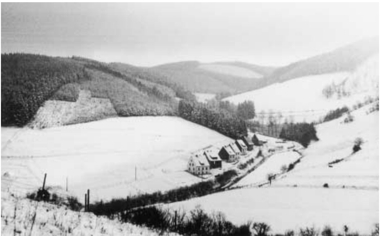
Siedlung Kehlscheid, 1960