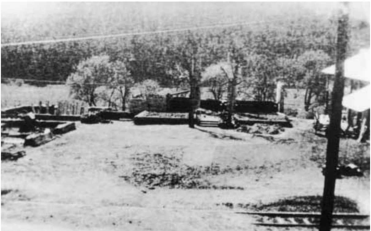
Hof Dümpelmann in Schutt und Asche, April 1945