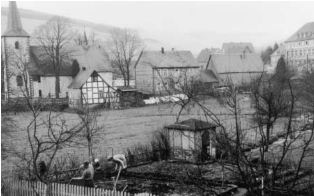
Kirche, alte Schule, Küsterei, Pfarrheim, 1956