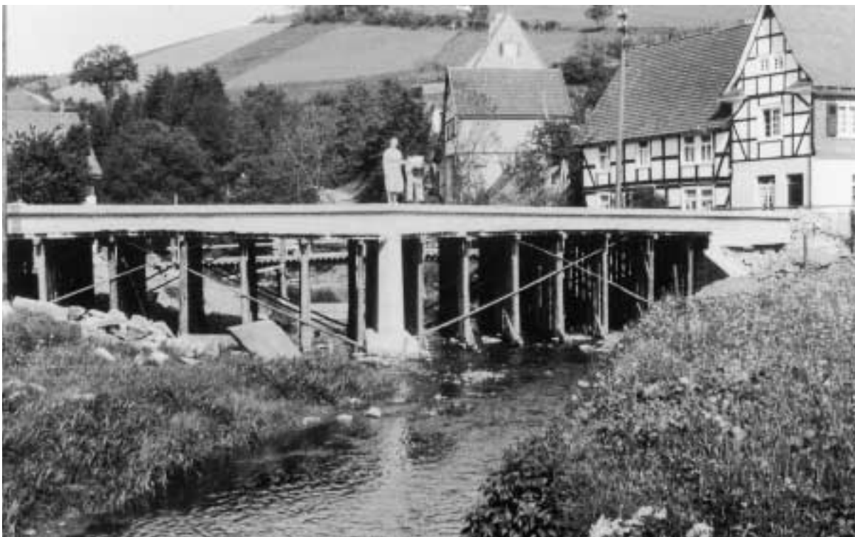
Neubau der Lennebrücke, 1953