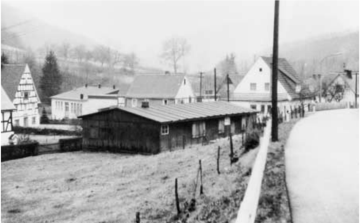
Während des 2. Weltkrieges als Notunterkunft erstellte Baracke, 1976, kurz vor dem Abriss