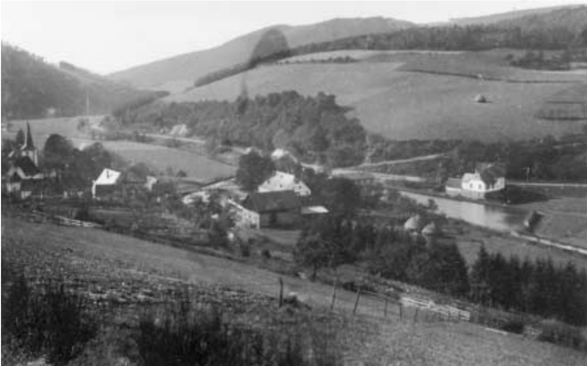
Dorfansicht mit Sternbergs Teich, 1932