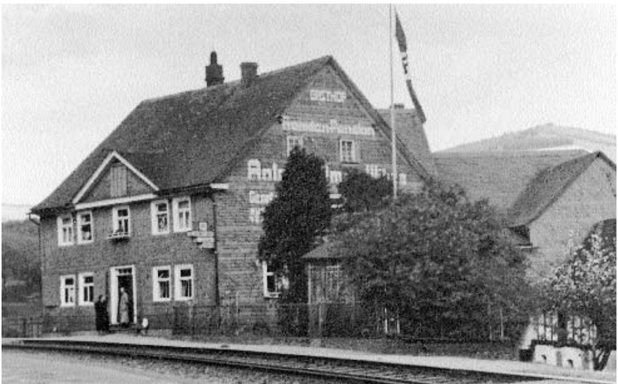
Haus Heimes Willmes, 1923