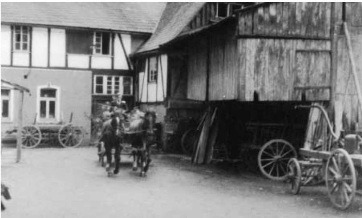
Mühle Kaspar Schürmann, 1948. Für den Festzug zum Gesangfest steht die Kutsche bereit. Rechts im Bild der alte Feuerwehrwagen.