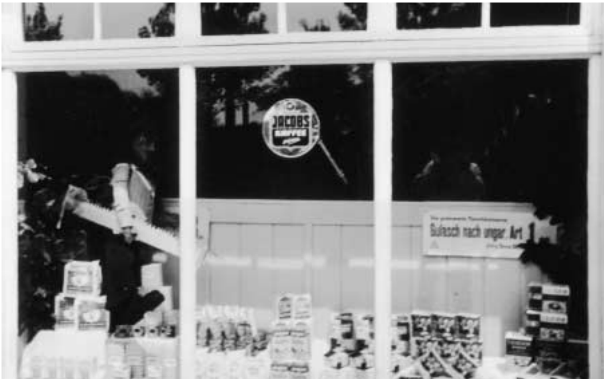
Geschäft Mues, 1951