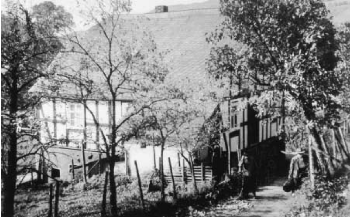
Königstraße bei Haus Schäfers, 1958