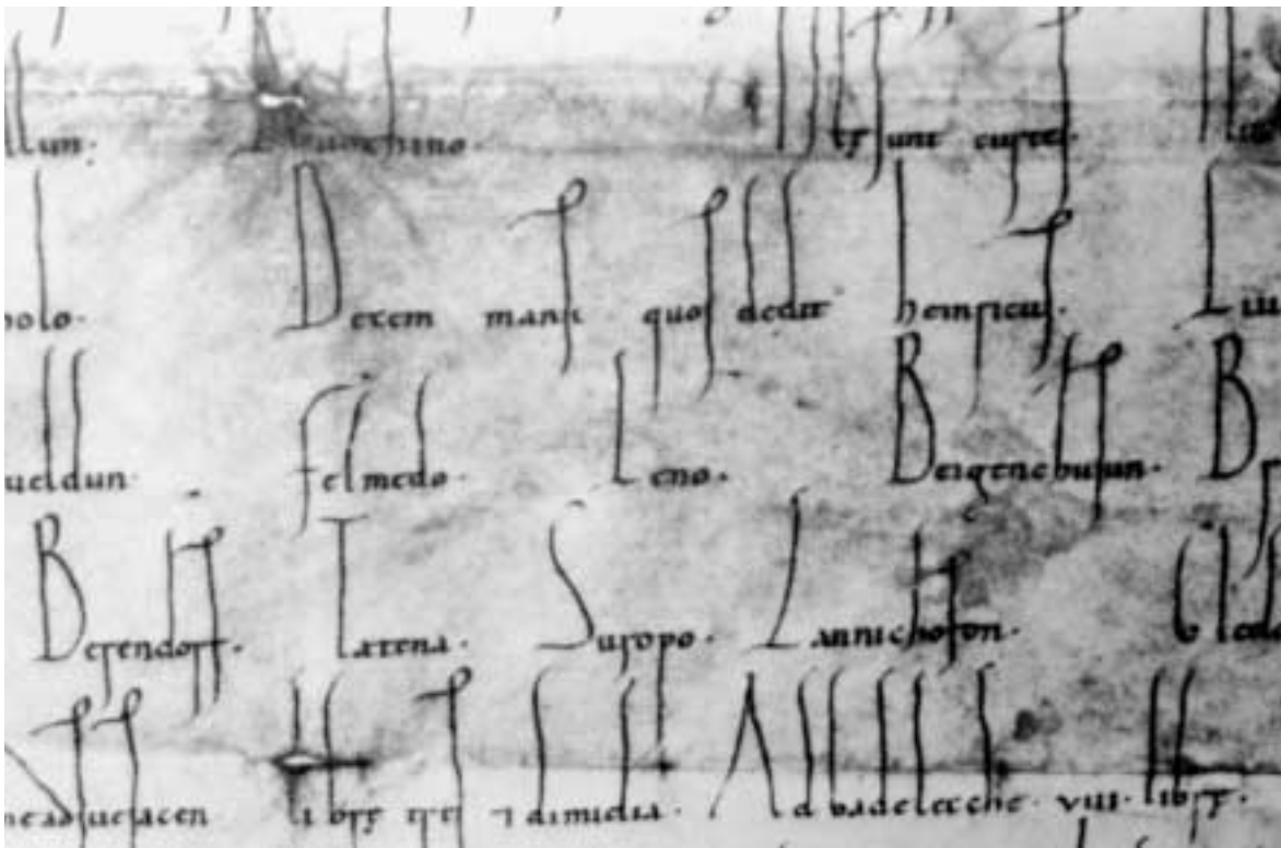
Gründungsurkunde des Klosters Grafschaft